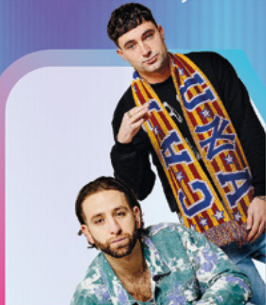
FLASHY ice CREAM