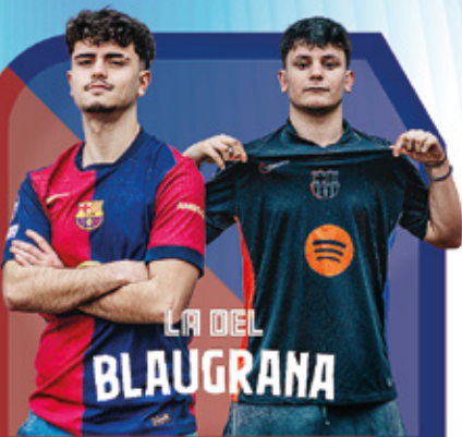
LA DEL BLAUGRANA